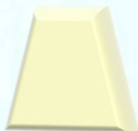
新世代洗剤 La Cube® ラ・キューブ